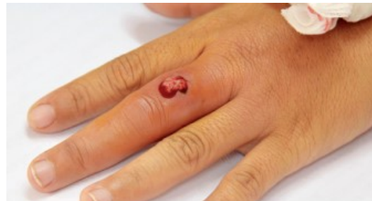
Heridas abiertas o infectadas