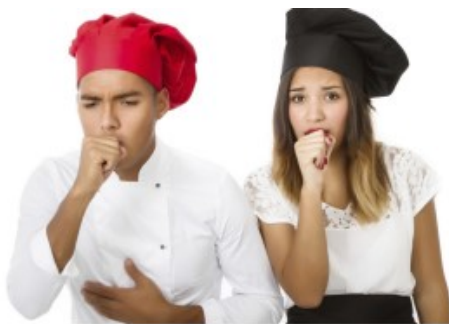
Estornudos y tos persistentes