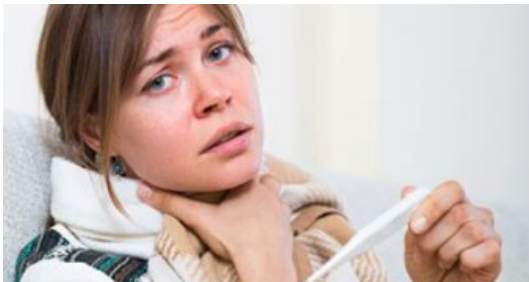
Fiebre con dolor de garganta